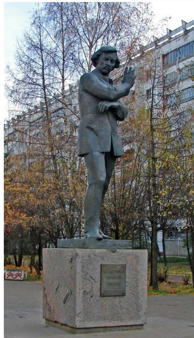
В 1990 году в Йошкар-Оле на бульваре Чавайна установлен памятник И.С. Ключникову-Палантаю.