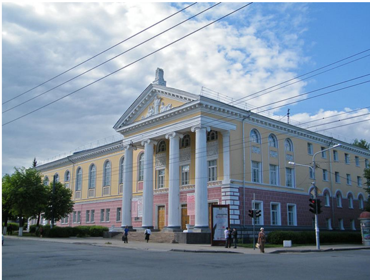
Марийский республиканский колледж культуры и искусств также носит имя Ивана Степановича Палантая.